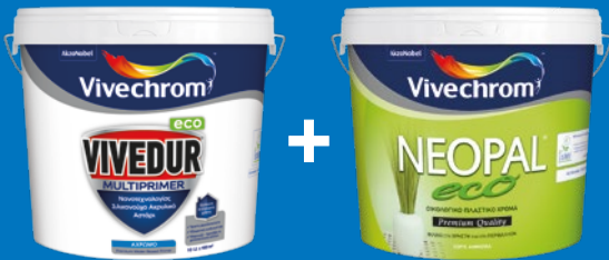
VIVEDUR MULTIPRIMER ECO + NEOPAL ECO