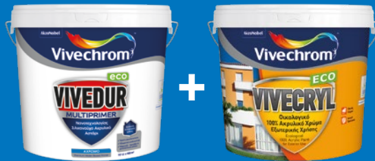
VIVEDUR MULTIPRIMER ECO + VIVECRYL ECO